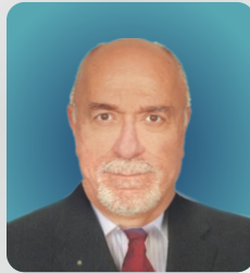
Nuri KIZILTAN SARSILMAZ SİLAH SANAYİ